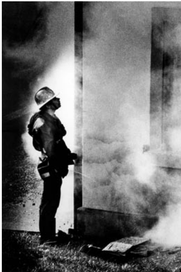
Pompier , 1980

La photo du chasseur de rats, c'était un reportage que je faisais sur les égouts. Ce chasseur de rats m'avait donné des bottes, on était à quatre pattes dans les égouts, lui devant avec sa lampe torche et son fusil... A la fin de la matinée, on a émergé d'une bouche d'égout en plein centre-ville. Les passants nous regardaient éberlués. En les voyant, il a brandi son rat, mimant la victoire. La photo a été publiée dans le livre Swiss People et exposée au musée de l'Elysée à Lausanne.»