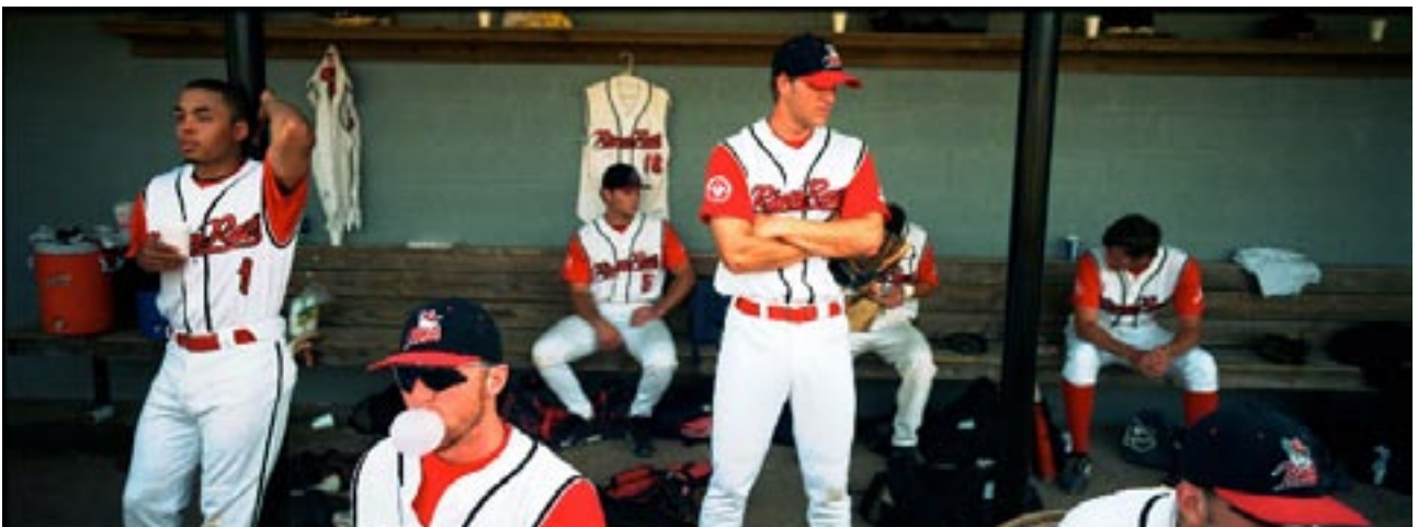
Baseball, USA, 2006

Les habitants de New Bern n'ont pas aimé ma version de leur vie américaine. En huit articles publiés sur deux mois, le journal local The Sun n'a pas publié une seule photo, que ce soit pour annoncer l'exposition locale et critiquer les images, ou pour débattre d'une polémique liée à ce projet. J'en conclus que la liberté de la presse aux Etats-Unis n'est pas si évidente que l'on pourrait le croire.»