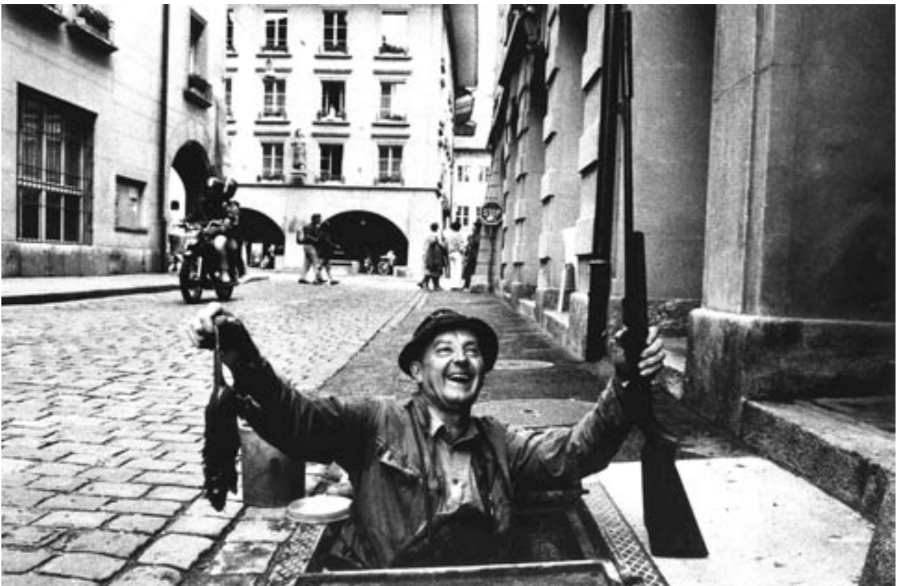
Chasseur de rats , 1984

Pendant presque dix ans, il s'est rendu dans un camp naturiste discret aux bords du lac de Neuchâtel. En Caroline du Nord, il a dressé le portrait d'une ville de l'Amérique profonde qui a déclenché une polémique dans le journal local. Au Soudan, il a rencontré des