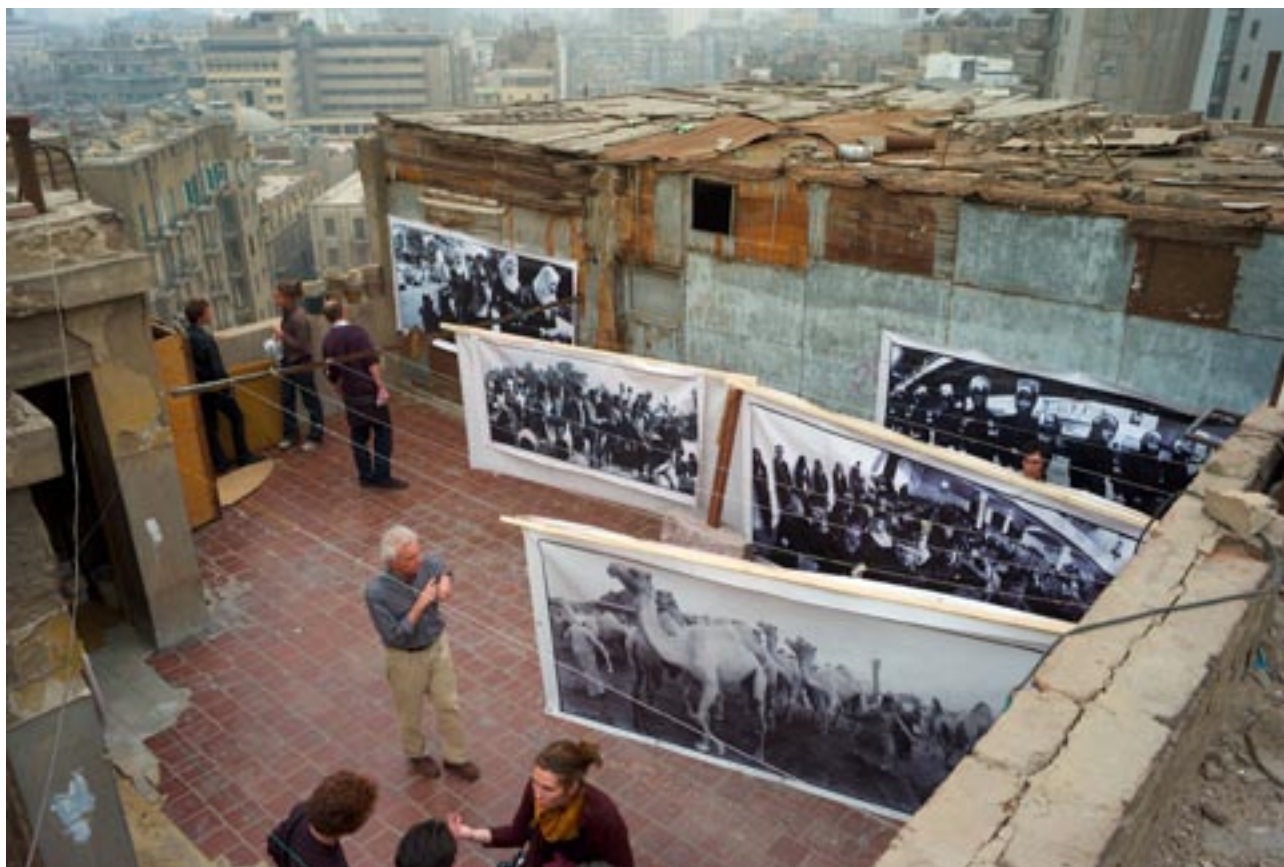
Inside Cairo, 2007, installation sur un toit du Caire

Une grande partie de son travail se présente en format panoramique, méthode qu'il pratique depuis 1991 avec un vieil appareil japonais. Ces grands tirages, au format de presque 3 mètres de longueur, visent à objectiver le monde, sans aucune recherche de dramatisation. Ils plongent le spectateur, comme le disait le commissaire d'exposition Harald Szeemann, « au cœur de l'événement ».