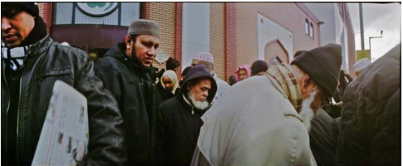
East London Mosque, 2010

La vidéo que j'ai réalisée sera projetée pour la première fois à la MEP.