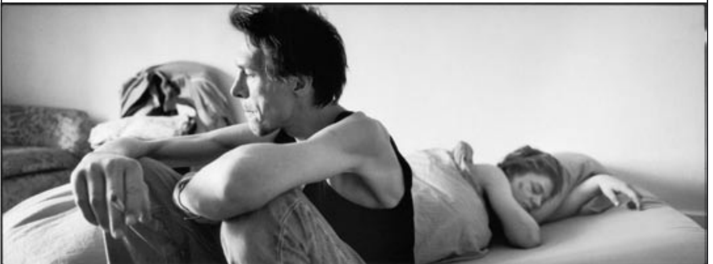
Astrid & Pierre I, 2004

Contact presse de la Maison Européenne de la Photographie Aurélié Garzuel - 01 44 78 75 01 - agarzuel@mep-fr.org