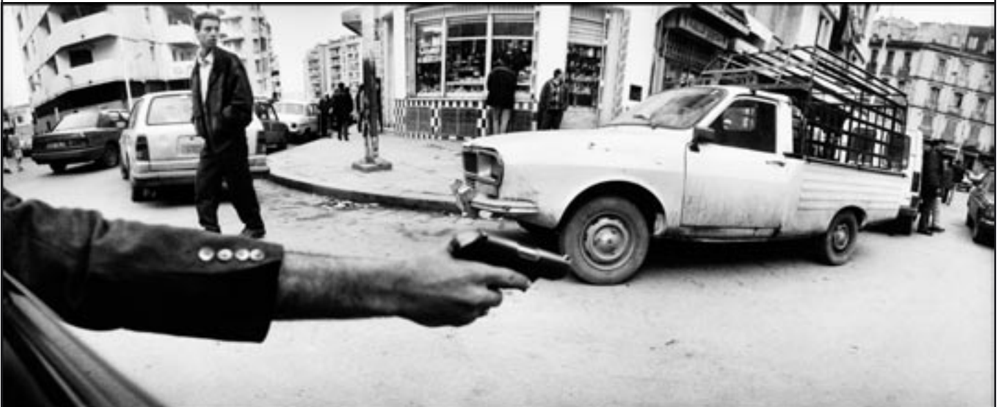
Peur d'un policier, Alger, 1996