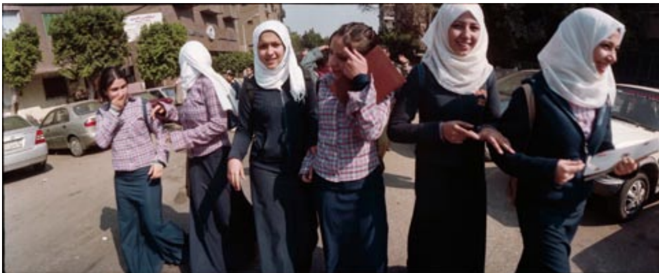
Ecolières, Caire, 2007

Mes «voisins » du dernier étage acceptent tout de suite de partager les lieux avec mes photos. Le jour dit, une centaine de visiteurs trouve le chemin du toit, au douzième étage. Le Daily Star publie une page sur l'exposition une semaine plus tard.»