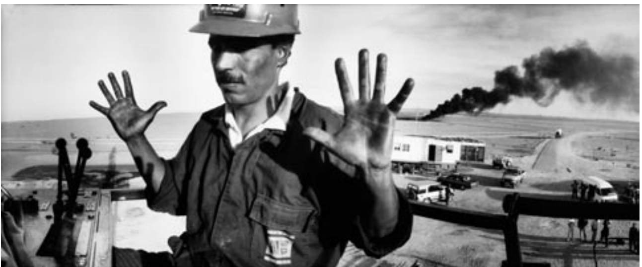
L'or noir, Hassi Messoud, 1995

Avec le réalisateur Mohammed Soudani, nous avons décidé de retourner sur place retrouver ceux que j'avais photographiés. Cela a donné le film « Algérie - je sais que tu sais », qui a été présenté au Festival International du Film de Locarno en été 2002. Pour eux, il constitue un début de travail de mémoire. Un tout petit début, mais un début quand même.»