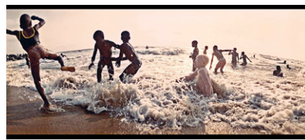
La plage à Kribi.