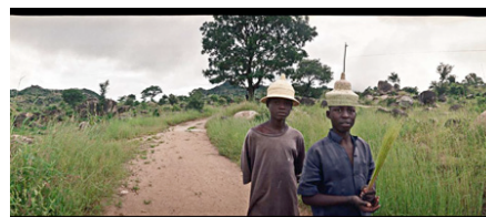
Près de Membza, Monts du Mandara.