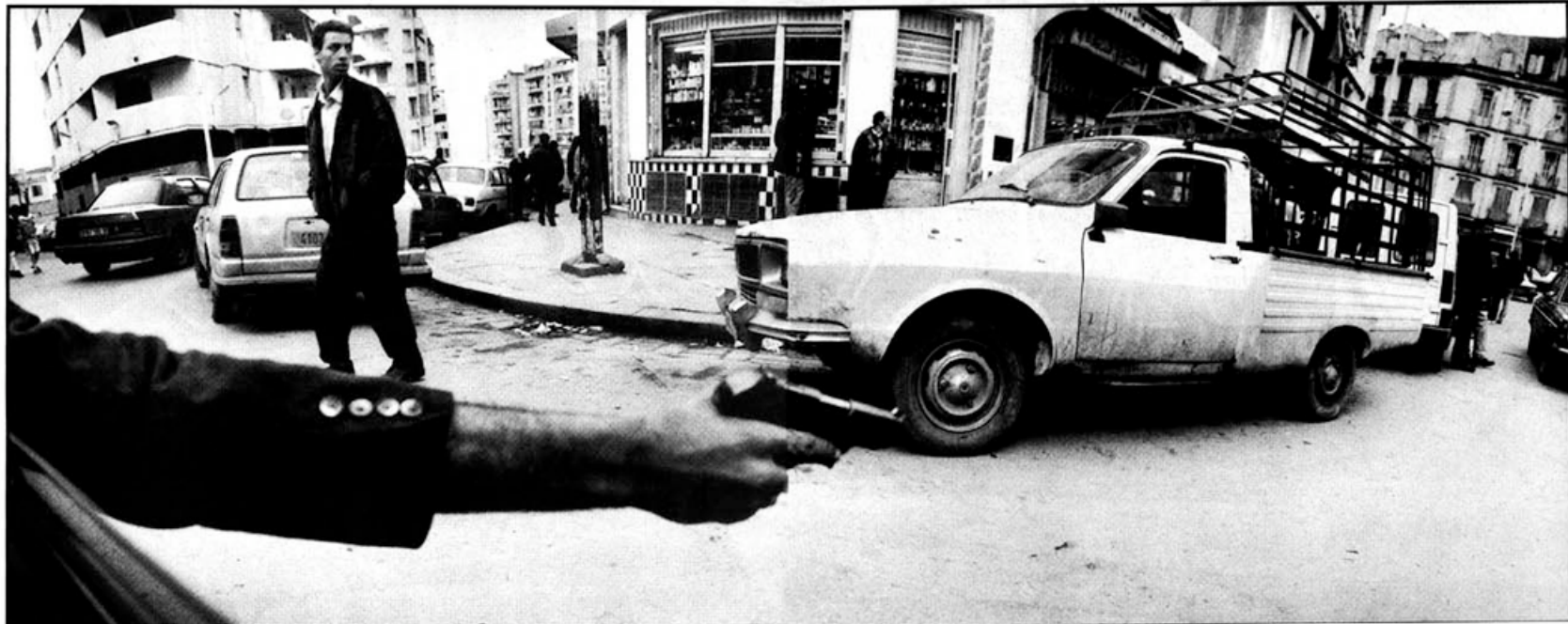
Straatbeeld in Algiers.